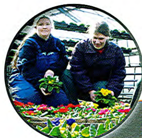
Gartenbau - FR: Garten- und Landschaftsbau und Zierpflanzen